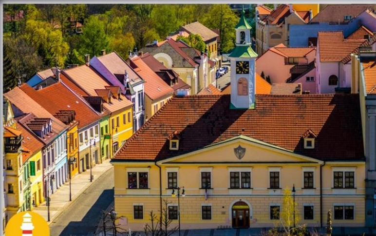
MĚSTSKÁ KNIHOVNA LOUNY